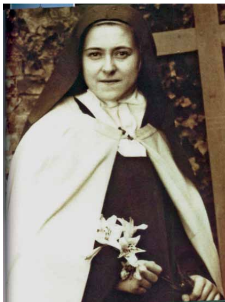
hl. Therese von Lisieux

und Bindung an Tugend. Das hat Europa groß gemacht. Im 9. Jahrhundert war das Abendland ein Armenhaus im Vergleich zu den Schätzen des Orients. Doch Bildung, Geist und Glaube haben im zweiten Jahrtausend einen weltgeschichtlich einmaligen Aufstieg ermöglicht. Wenn diese Leitsterne