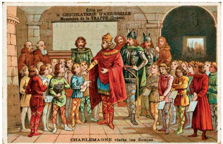
Karl der Große besucht eine Schule

Unter den Schulheften der hl. Theresse von Lisieux (1873-1897) findet sich eines mit einem illustrierten Deckblatt. Darauf erkennt man den hl. Karl den Großen inmitten einer Schar von Schülern. „Charlemagne visitant les écoles. - Karl der Große beim Besuch der Schulen“, lautet die Bildunterschrift. In einem begleitenden Text wird der historische Hintergrund erläutert: Karl der Große gründete viele Schulen, u.a. in seinem eigenen Palast hier in Aachen. Er besuchte sie häufig und befragte die Schüler. Dabei mahnte er sie stets zur rechten Einstellung: „Ihr seid reich und die Ersten des Reiches. Aus diesem Grund meint ihr, Geburt und Wohlstand reichen aus, und diese Schule habt ihr nicht nötig, die euch doch so sehr zur Ehre gereichen würde. Nur äußeren Schmuck, Spiele und Vergnügungen habt ihr im Sinn. Doch das eine schwöre ich euch: Ich werde eurem Adel und eurem Reichtum keinerlei Beachtung schenken, die euch doch so viel Ansehen einbringen. Und wenn ihr nicht schleunigst die in Dummheiten vergeudete Zeit wieder durch eifriges Lernen wettmacht, so werdet ihr niemals überhaupt irgendetwas von Kaiser Karl erhalten!“ 1